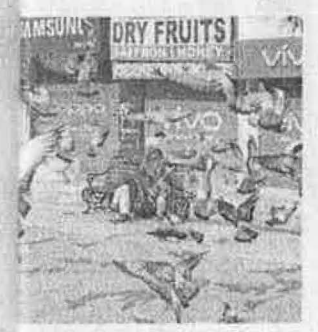
g a shutdown at Lal Chowk in economy of the State badly